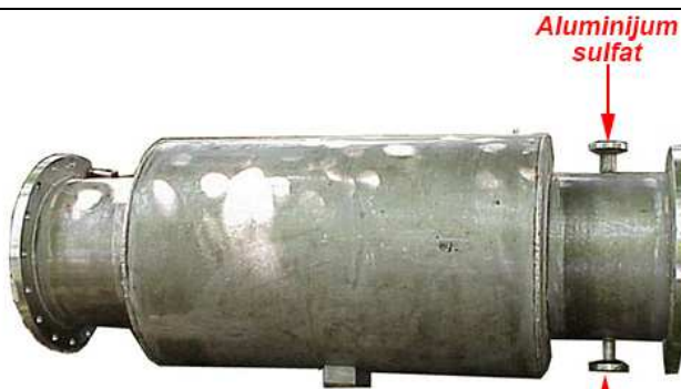
STATIČKI CEVNI MEŠAČ